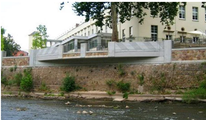
Verkleidete HWS-Mauer mit Balkon an einem Zufluss vom Rhein

Unverkleidete Spundwände, wie diese im Hafenbau üblich sind, werden in Städten, in denen die HWS-Anlagen auch zugänglich sind, seltener eingesetzt, sind jedoch hinsichtlich des Erscheinungsbildes sicherlich den verkleideten Varianten nicht gleichgestellt (vgl. Abb. 5).