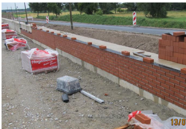
Verlinkerte HWS-Wand ausgeführt als wasserseitige Spundwand am Niederrhein

Abb. 3 zeigt zwei Beispiele, bei denen der Hochwasserschutz in Form von Spundwänden, welche später verkleidet wurden, hergestellt wurde. Die Einbindung in das Städtebildung und einer Erhöhung auf engstem Raum ist somit möglich gewesen.