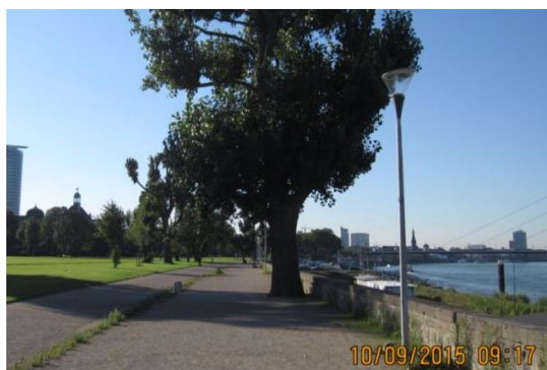
Große Einzelbäume an einer HWS-Mauer in einer Großstadt am Rhein

Sofern noch keine Bestandsmauern vorhanden sind, hat man bei der Ausgestaltung neben den technisch notwendigen Zwangspunkten noch relativ viele Freiheitsgrade (siehe Abb. 2, rechts).