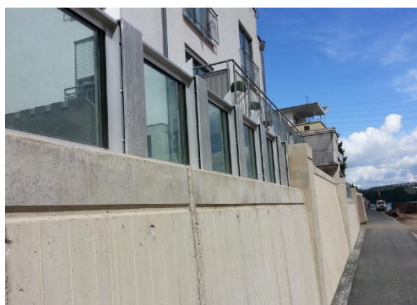
HWS-Wand mit aufgesetzten schuss- und stoßsicheren Glaselementen am Mittelrhein