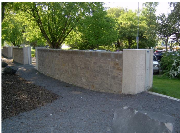
HWS-Mauer in Kombination mit mobilen Verschlüssen (Dammbalken) am Mittelrhein