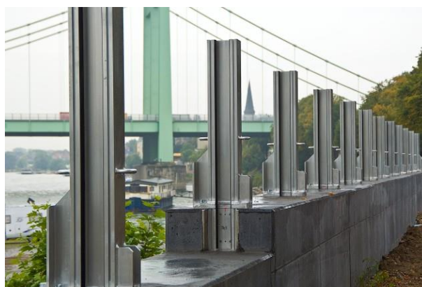
HWS-Wand mit aufgesetztem Dammbalkensystem in einer Großstadt am Rhein