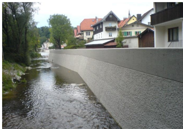
HWS-Mauer mit unterschiedlich gestalteten Betonoberflächen an der Isar