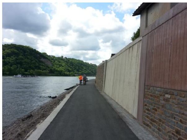
Unterschiedlich gestaltete HWS-Mauern mit Sichtbeton, Naturstein und gefärbten Beton am Mittelrhein