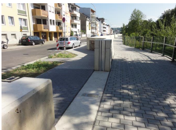
Einfache HWS-Wand ohne Verkleidung mit integrierten Dammbalkenverschlüssen