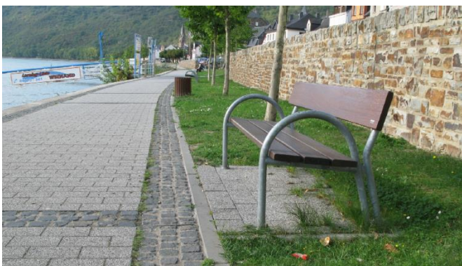
Gestaltung eines Fahrrad- und Fußgängerweges mit Sitzgelegenheit an einer verkleideten HWS-Mauer am Rhein