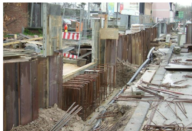
Verkleidete HWS-Wand ausgeführt mit mobilem Verschluss entlang Verbauung und Straße am Niederrhein