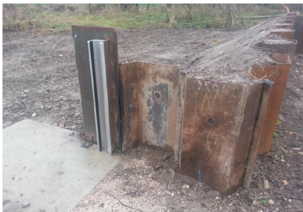
Unverkleidete Spundwand mit mobilem Verschluss im Rahmen einer Sofortsicherungsmaßnahme an der Saalach