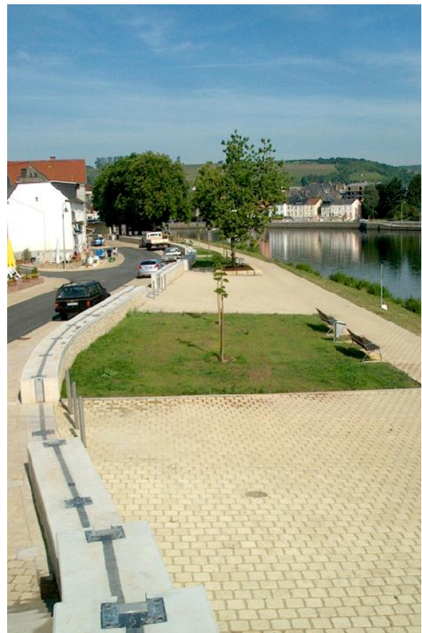
Geschwungene HWS-Mauer mit aufgesetzten Dammbalken an der Mosel